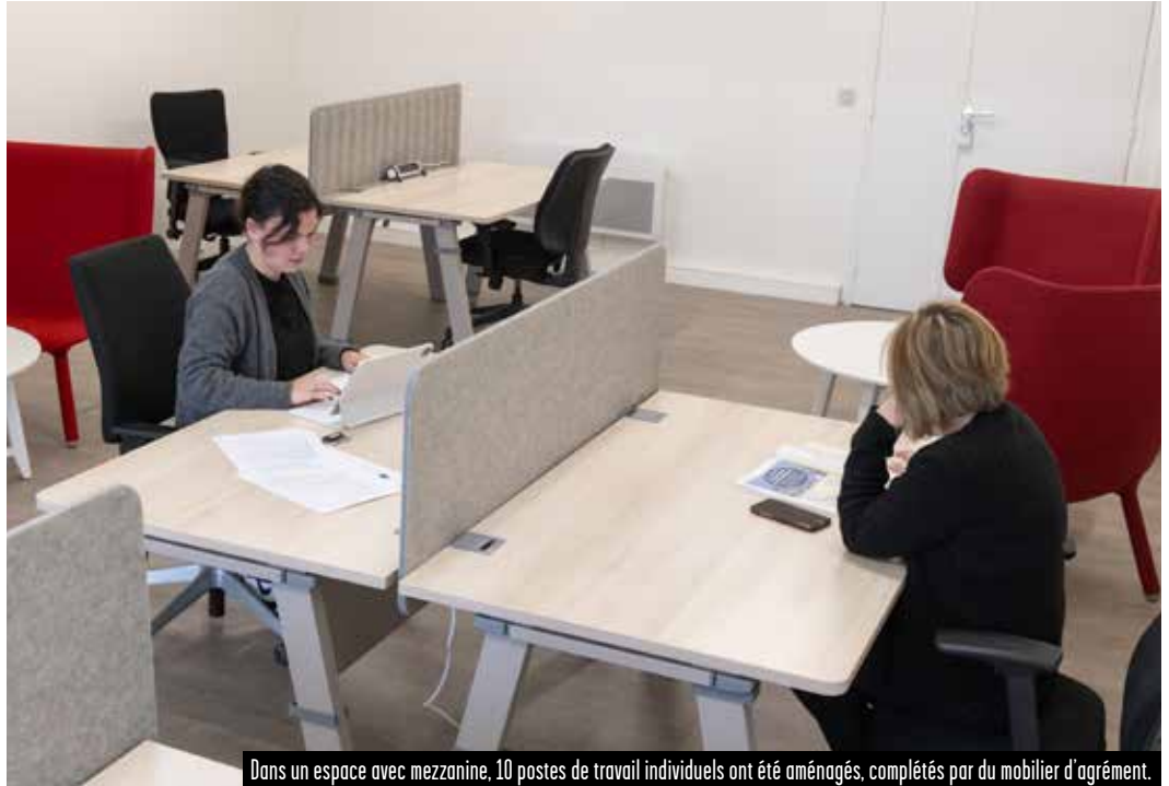
Dans un espace avec mezzanine, 10 postes de travail individuels ont été aménagés, complétés par du mobilier d'agrément.

— Voilà un nouvel espace de travail partagé qui va intéresser entrepreneurs et salariés. Accessible sur réservation de manière très souple, il s'intègre harmonieusement à l'hôtel d'entreprises Confluence.