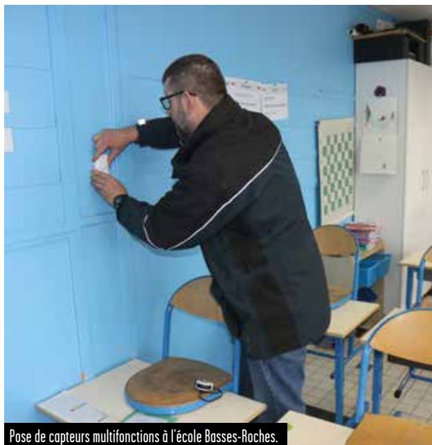
Pose de capteurs multifonctions à l'école Basses-Roches.