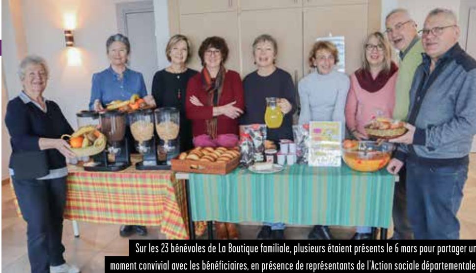
Sur les 23 bénévoles de La Boutique familiale, plusieurs étaient présents le 6 mars pour partager un moment convivial avec les bénéficiaires, en présence de représentants de l'Action sociale départementale.