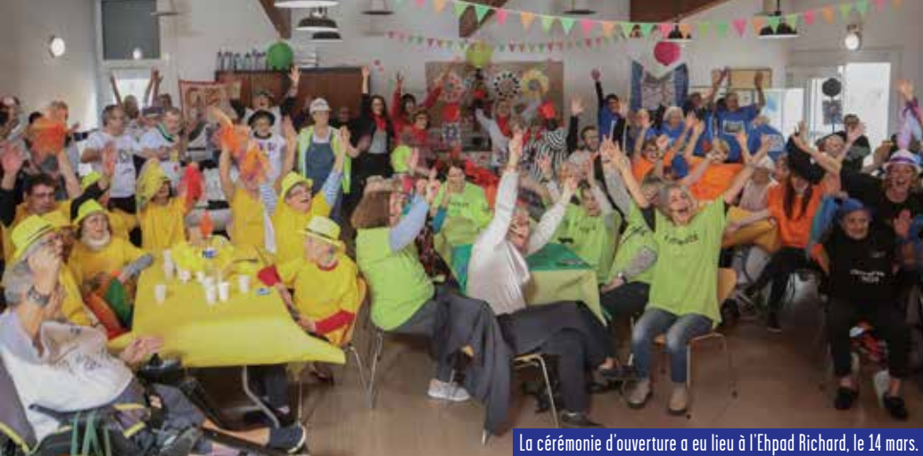
La cérémonie d'ouverture a eu lieu à l'Ehpad Richard, le 14 mars.