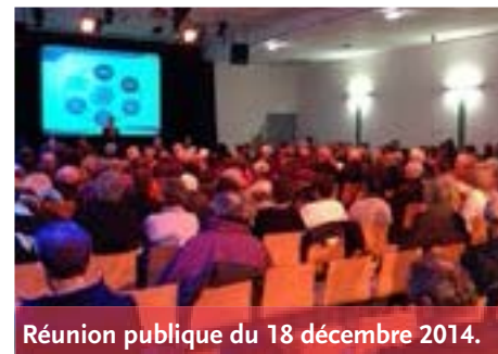
Réunion publique du 18 décembre 2014.

De plus, la présence d'emprunts toxiques, décidés par l'ancienne Municipalité, grève considérablement nos capacités de financement pour l'avenir.