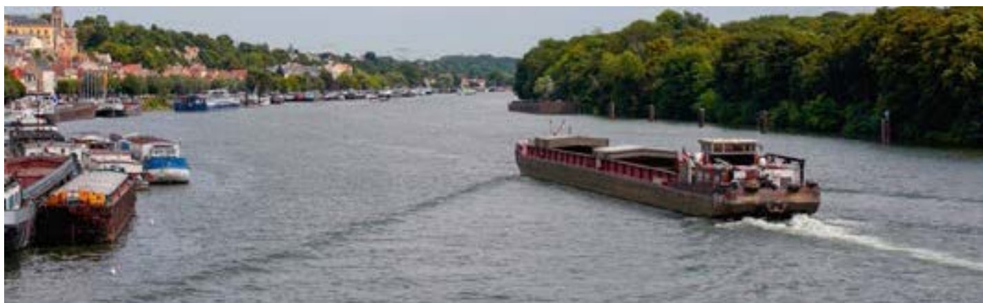
Le fleuve doit être un facteur de relance économique pour la ville de Conflans-Sainte-Honorine dès cette année 2015.

J'ai souhaité que l'année 2015 soit celle du fleuve. Celui-ci est un vecteur essentiel à l'attractivité économique de notre ville et au développement de nos futures ressources. La réouverture du Musée de la Batellerie, l'arrivée de bateaux - commerces et le réaménagement de la place Fouillère traduisent une ambition qui doit fédérer l'ensemble des Conflanais. C'est l'objectif le plus important de l'équipe municipale qui m'entoure.